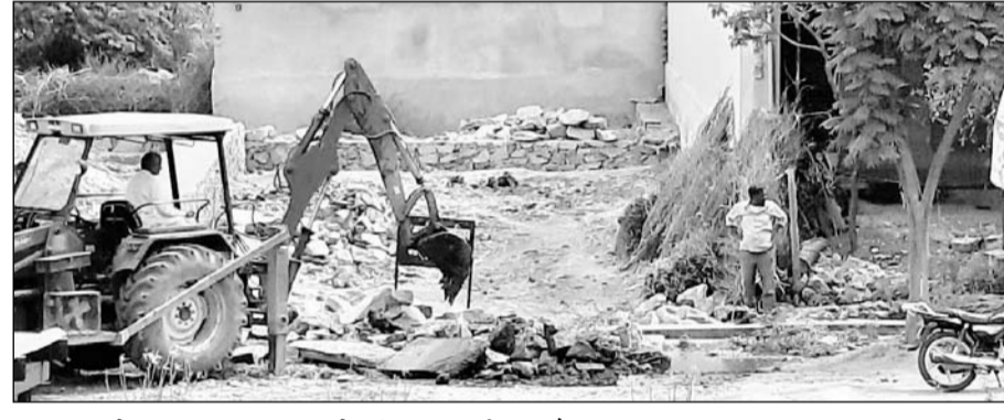
अस्पताल रोड पर अतिक्रमण हटाने की खानापूर्ति कर लौटा पालिका दस्ता।