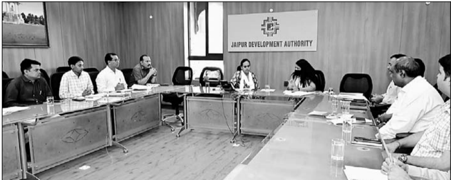
जयपुर विकास प्राधिकरण के चिन्तन सभागार में मंगलवार को द्रव्यवती नदी परियोजना की रिव्यू बैठक आयोजित की गई।

जयपुर। मंगलवार को चिन्तन सभागार में द्रव्यवती नदी परियोजना की रिव्यू बैठक आयोजित की गई। बैठक में जयपुर विकास प्राधिकरण द्वारा