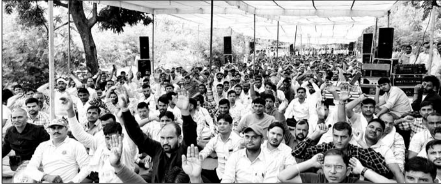
राजस्थान विद्युत तकनीकी कर्मचारी एसोसिएशन के प्रदेश व्यापी आन्दोलन पर अपनी मांगों को लेकर मंगलवार को जयपुर के विद्युत भवन में हल्ला बोल धरना दिया।

जयपुर। राजस्थान विद्युत तकनीकी कर्मचारी एसोसिएशन के प्रदेश व्यापी आन्दोलन पर 16 सूत्री मांग पत्र को लेकर आज 17 सितम्बर मंगलवार को जयपुर के विद्युत भवन में हल्ला बोल धरना दिया। इस प्रदर्शन में प्रदेश भर के हजारों की संख्या में कर्मचारी जयपुर पहुंचे।