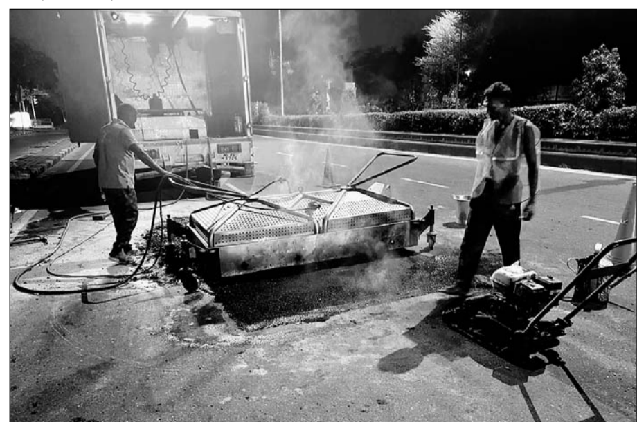
जयपुर विकास प्राधिकरण द्वारा जयपुर शहर में वर्षों एवं अन्य कारणों से क्षतिग्रस्त सड़कों का पेचवर्क कार्य तीव्र गति से करवाया जा रहा है।