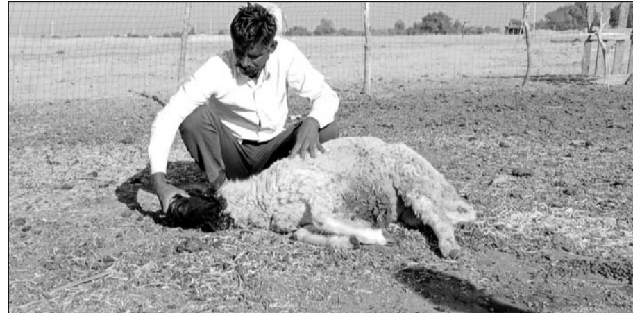
जैसलमेर के सावता गांव में भेड़ की मौत के बाद दुखी किसान।

अधिकारियों से नहीं मिल रहा संतोषजनक जवाब