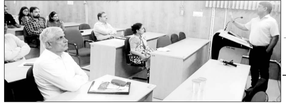
हरीशचन्द्र लोक माथुर प्रशिक्षण संस्थान में शहरी विकास पर विशेषज्ञों ने विचार साझा किए।