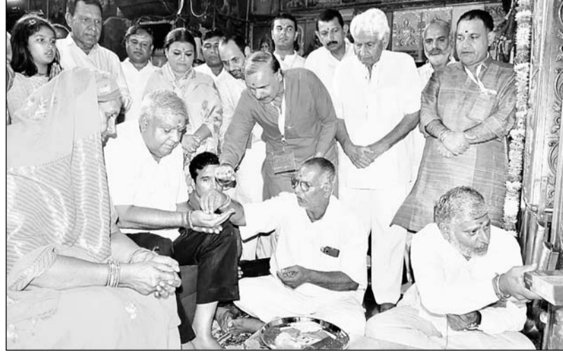
उपराष्ट्रपति धनखड़ और उनकी पत्नी डॉ. सुदेश धनखड़ को सालासर मंदिर के पुजारियों ने विधि-विधान से पूजा अर्चना करवाई।