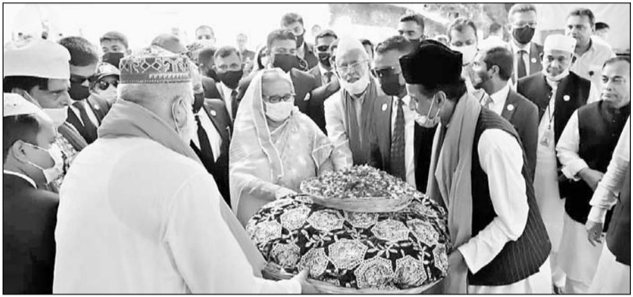
बांग्लादेश की पीएम ने प्रतिनिधिमंडल के साथ चादर चढ़ाकर अकीदत के फूल पेश किए।