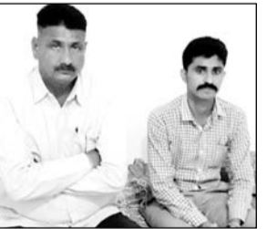
एसीबी की गिरफ्त में आरोपी।