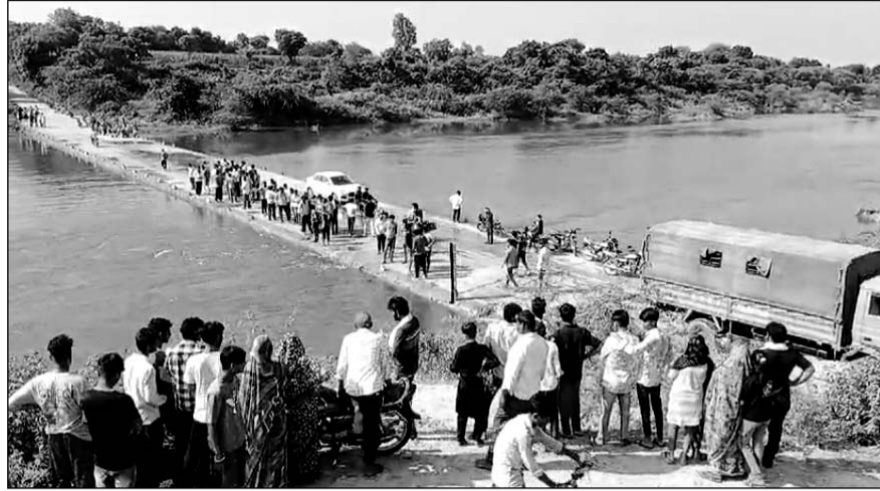
मांडलगढ़ में बीगोद के पास बनास नदी में बहे मां-बेटे के शव 21 घण्टे बाद मिले।