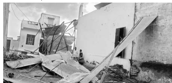
चाकसू में तेज अंधड़ और बारिश से कई जगह पर टीनशेड उड़ गये।

बिजली के पोल व तार टूट गए जिससे पूरे कस्बे में बिजली बंद हो गयी अंधड़ की रफार इतनी तेज थी किसी को सम्भलने का ही मौका नहीं मिल सका। अंधड़ के बाद बादलों की तेज गर्जना के साथ जोरदार बारिश हुई सड़कों पर पानी ही पानी हो गया। छोटे-मोटे गड्ढे पानी से लबाबल हो गये। हालांकि इस दौरान हुई वर्षा से लोगों को गर्मी से राहत मिल गई और मौसम