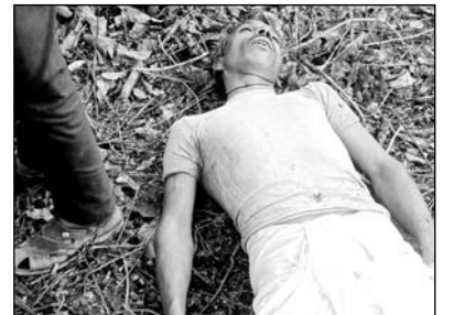
बून्दी जिले के पटपड़िया के नजदीक भुजर घाटे पर आकाशीय बिजली गिरने से तीन व्यक्तियों की मौत हो गई।