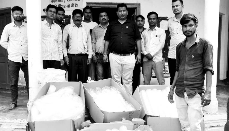
बीदासर पालिका टीम ने प्रतिबंधित सिंगल यूज प्लास्टिक के खिलाफ छापेमारी की।

बीदासर, (निर्सं)। नगर पालिका की गठित टीम ने बुधवार को प्रतिबंधित सिंगल यूज प्लास्टिक के खिलाफ छापेमारी करते हुए करबे के मुख्य बाजार से एक क्विंटल पांच किलो पॉलीथिन व डिस्पोजल जर्बत कर चार हजार रूपये की जुरमांना राशि वसूल की। पालिका की टीम के ज्योंही बाजार में पहुंचने की सूचना मिली तो व्यापारियों में हड़कंप मंच गया। छापेमारी के डर से कई दुकानदारों ने अपनी दुकानों के शटर गिराकर भाग गए।