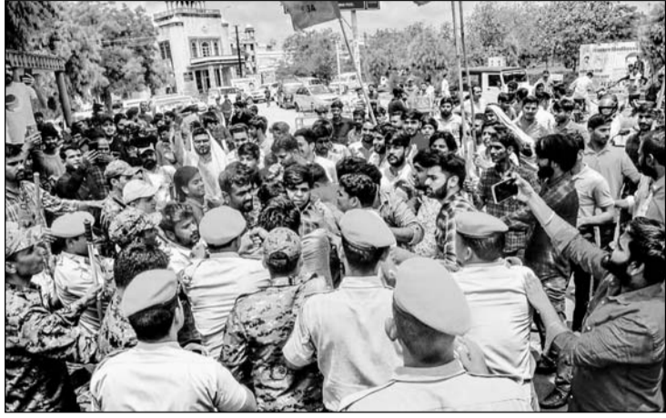
गांधी नगर की पोद्दार स्कूल में रीट परीक्षार्थी की ओएमआर शीट एक घंटे तक गायब होने, पेपर सोशल मीडिया पर वायरल होने और अभ्यर्थियों से अभद्रता से नाराज एबीवीपी कार्यकर्ताओं ने सोमवार को राजस्थान यूनिवर्सिटी के बाहर प्रदर्शन किया।

वहीं दूसरी ओर रीट परीक्षा की चौथी पारी का पेपर सोशल मीडिया पर वायरल होने का मामला तूल पकड़ता जा रहा है। एबीवीपी ने सोमवार को राजस्थान विश्वविद्यालय के मुख्य