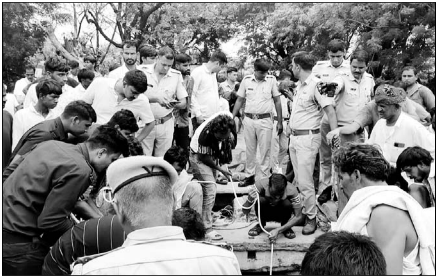
पुलिस ने ग्रामीणों के सहयोग से तीनों के शवों को कुएं से निकलवाया।

भीलवाड़ा, (नि.सं.)। शहर के सुभाष नगर थाना क्षेत्र के सालारा गांव में पति से पारिवारिक कलह के चलते विवाहिता ने नौ माह के नवजात बेटे और सात साल की मासूम बेटी के