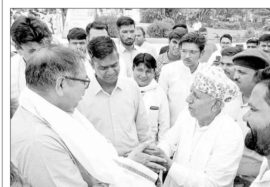
भाजपा राजस्थान पूर्व प्रदेशाध्यक्ष डॉ. सतीश पुनिया ने आज किशनगढ़ पहुंचकर केंद्रीय कृषि राज्यमंत्री भागीरथ चौधरी की जन्मदिवस की शुभकामनाएं दीं और ईश्वर से सुदीर्घ जीवन की मंगल कामना की।