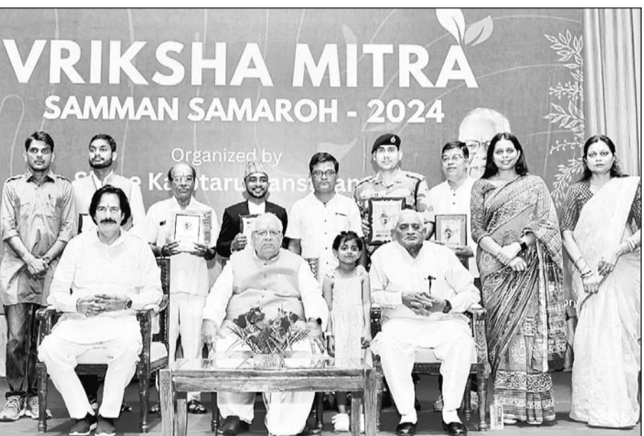
राज्यपाल कलराज मिश्र ने रविवार को श्री कल्पतरु संस्थान की ओर से आयोजित वृक्ष मित्र सम्मान समारोह में संबोधित किया।

जयपुर, (का.सं.)। राज्यपाल कलराज मिश्र ने कहा है कि प्रकृति और पर्यावरण की भारतीय संस्कृति का संरक्षण जरूरी है। उन्होंने अधिकाधिक पेड़ लगाए जाने का आ आन करते हुए कहा कि प्रकृति के आंतरिक संतुलन को क्षति पहुंचाए बिना विकास की सोच को मूर्त रूप दें। उन्होंने कहा कि वृक्ष एवं वनस्पतियां भूमि को उन्नत और उर्वरा ही नहीं बनाते बल्कि सबका भरण पोषण भी करते हैं।