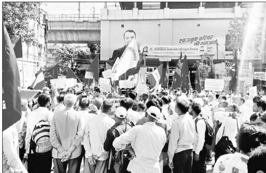
जयपुर में सिंधी कैंप बस स्टैंड के निकास द्वार पर सैकड़ों सेवारत-सेवानिवृत्त कर्मचारियों ने रोडवेज प्रशासन के विरोध में नारे लगाए।