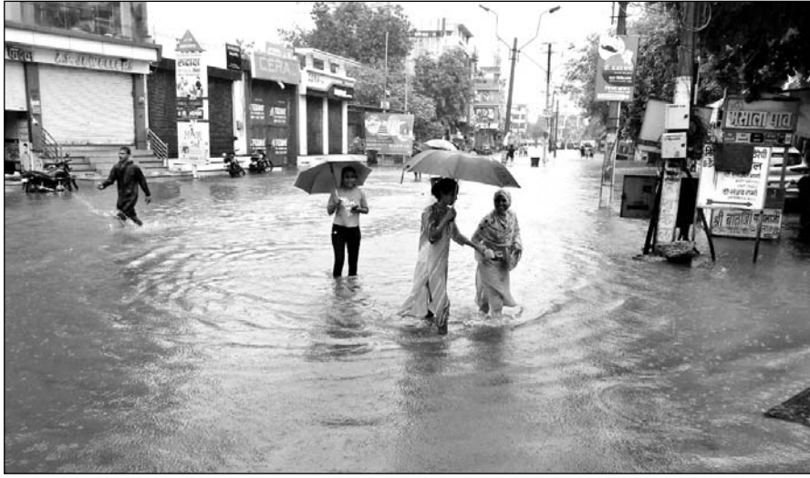
पाली जिले में रविवार देर रात शुरू हुई बारिश के बाद कई इलाकों में बाढ़ के हालात हो गये।

नया गांव स्थित सरकारी स्कूल पानी से डूब गया। स्कूल के प्रिंसिपल