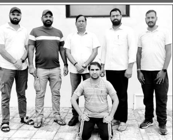
एंटी गैंगस्टर टास्क फोर्स पुलिस मुख्यालय की टीम ने मुल्लाका हत्याकांड के एक और आरोपी पकड़ा।