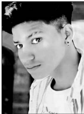
पुलिस ने हत्या के मामले में दो आरोपियों को गिरफ्तार किया।