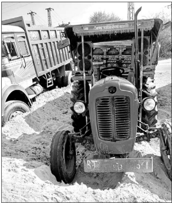
टोंक में पुलिस ने अवैध बजरी से भरा ट्रैक्टर-ट्रॉली जब्त किया।