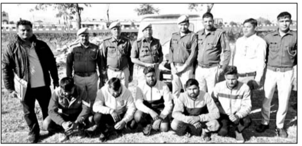
पुलिस ने हमला करने के आरोपियों को गिरफ्तार किया।