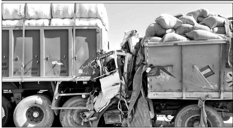
अजमेर-भीलवाड़ा हाईवे पर स्थित कोठारी नदी की पुलिया पर घने कोहरे से कई वाहन टकरा गए, इनमें एक यात्री बस भी शामिल है।

अजमेर-भीलवाड़ा हाईवे पर स्थित कोठारी नदी की पुलिया पर हादसा हुआ