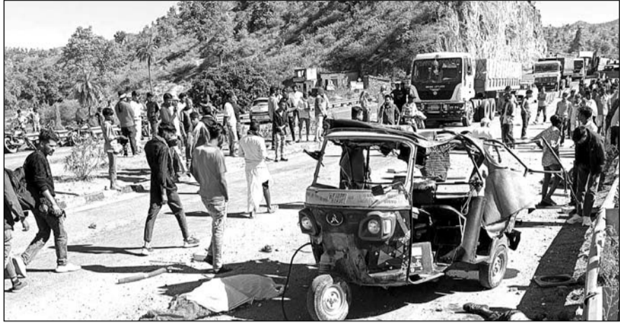
पिण्डवाड़ा हाईवे पर हुये हादसे के बाद मौके पर लोगों की भीड़ लग गई।

गोगुन्दा-पिण्डवाड़ा हाईवे पर सड़क पर हुआ हादसा, ऑटो चालक सहित नौ जने घायल