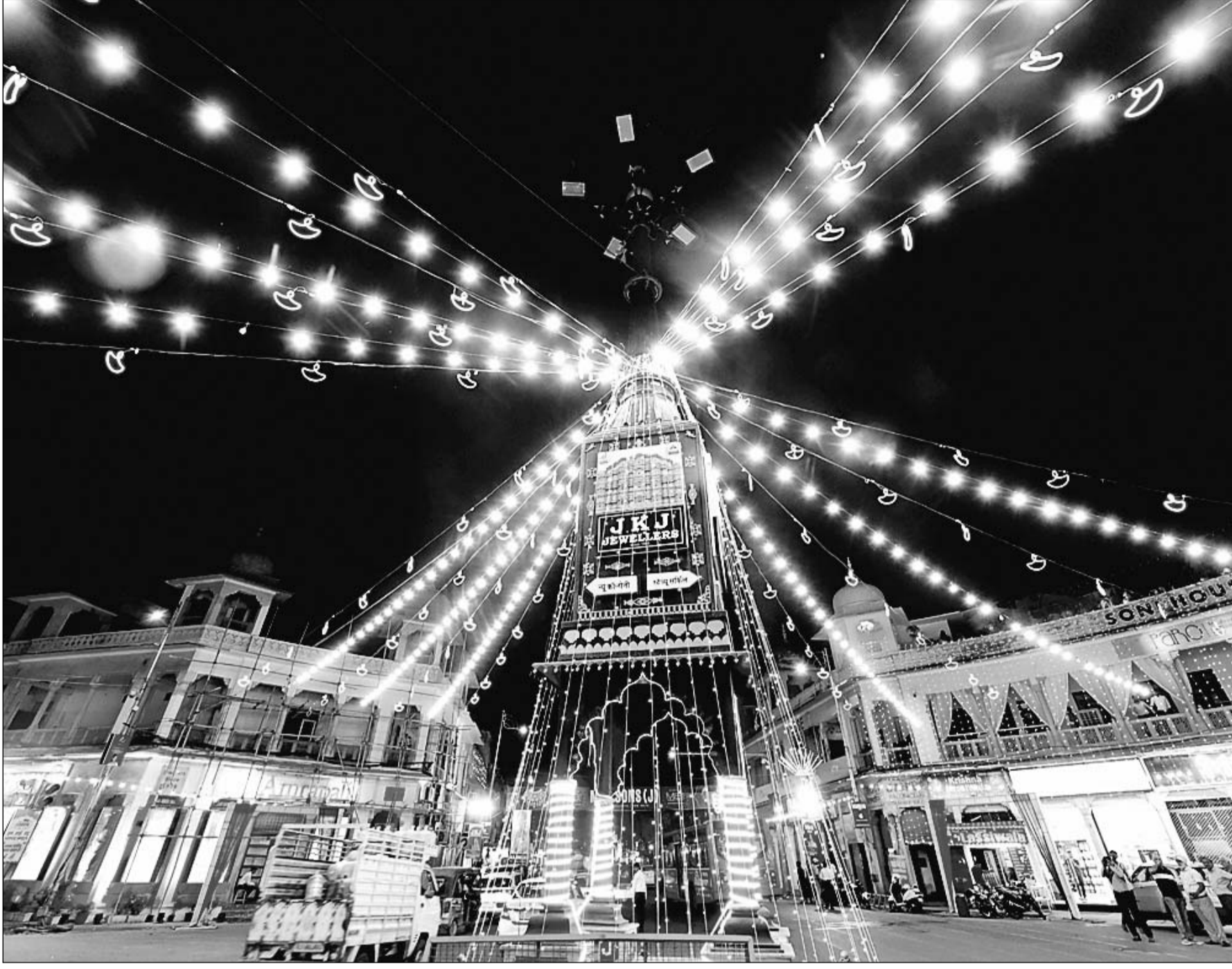
दीपोत्सव के लिये जगमगाने लगी गुलाबी नगरी। एम.आई.रोड पर लाइटिंग से जगमग पांचबत्ती चौराहा।