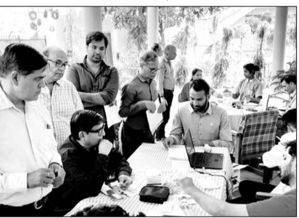
पिंकसिटी प्रेस क्लब में रविवार को निशुल्क चिकित्सा परामर्श एवं जांच कैम्प आयोजित किया गया।

जयपुर। पिंकसिटी प्रेस क्लब में रविवार को प्रियंका हॉस्पिटल कार्डियक सेंटर के सहयोग से निशुल्क चिकित्सा परामर्श एवं जांच कैम्प आयोजित किया गया। पिंकसिटी प्रेस क्लब की ओर से आयोजित इस कैम्प में पत्रकारों, मीडिया संस्थानों के विभिन्न विभागों में कार्यरत कार्मिक और उनके सैकड़ों परिवारों ने विभिन्न स्वास्थ्य विशेषज्ञों से निशुल्क चिकित्सा परामर्श और जांच का लाभ लिया।