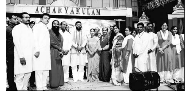
स्वामी रामदेव व आचार्य बालकृष्ण द्वारा स्थापित आवासीय शिक्षण संस्थान आचार्यकुलम् का वार्षिकोत्सव रविवार को धूमधाम से संपन्न हुआ।