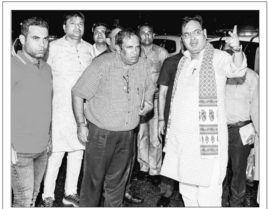
मुख्यमंत्री भजनलाल शर्मा ने सोमवार शाम को जयपुर शहर में हुई तेज बारिश के दौरान जवाहर सर्किल, मालवीय नगर अंडर पास, सांगानेर क्षेत्र, चोमू पुलिसिया, ढेर के बालाजी चौराहा, 9 नंबर और 14 नंबर चौराहे का जायजा लिया।