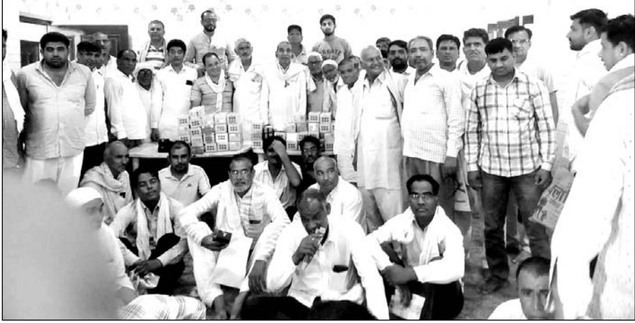
कमीशन और मेहनताना की मांग को लेकर आयोजित बैठक में राशन विक्रेताओं ने रोष जताया।