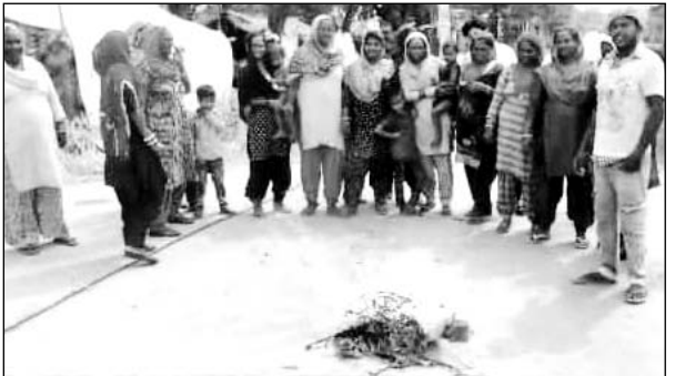
मांगों को लेकर पुतला दहन कर विरोध प्रदर्शन किया।