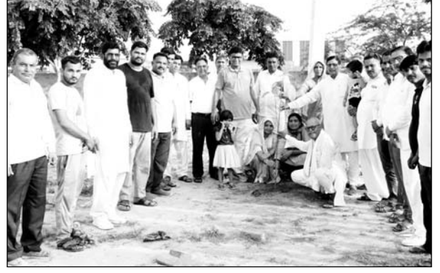
अंबेडकर विकास संस्थान राजगढ़ में 51 पौधे लगाकर अभियान का समापन पूर्वक समाप्त किया।