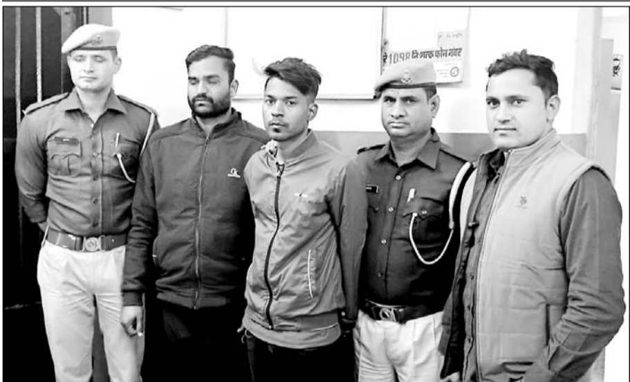
पुलिस ने आरोपियों को गिरफ्तार किया।

जुए की लत से कर्जदार बन गये थे दोनों युवक