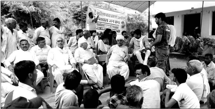
कालिया बाबा काला पहाड़ को खनन से बचाने और इसे धार्मिक क्षेत्र घोषित करने की मांग को लेकर चल रहे आन्दोलन में कई जनप्रतिनिधियों ने शिरकत की।

लोगों ने कहा कि सभी लीजों को समाप्त कराने के लिये आन्दोलन जारी रहेगा। इस पर्वत की गुफाओं में अनेकानेक संत-महात्मा तपस्या करते हैं और संत भक्तों द्वारा अनवरत