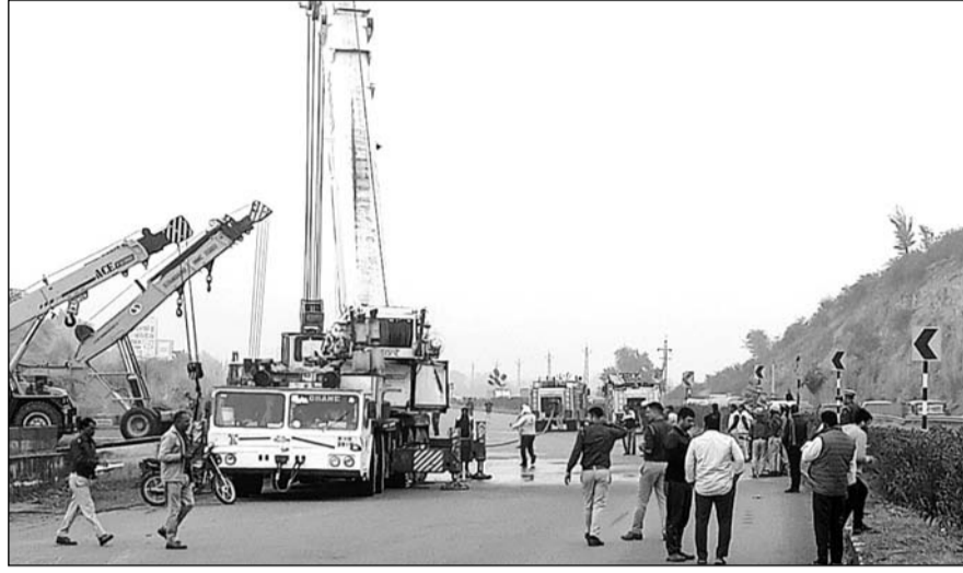
टैंकर पर पानी डालते हुए टैंकर को हाइड्रो क्रेन से सीधा किया गया।