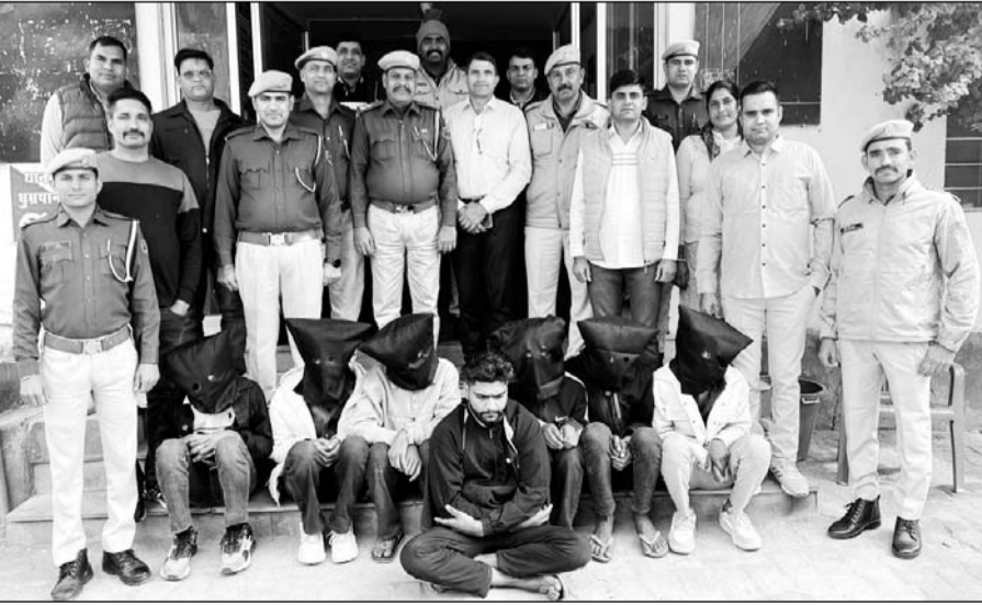
पुलिस ने बुजुर्ग का अपहरण करने वाले सात आरोपियों को गिरफ्तार कर छह को बापर्दा रखा।