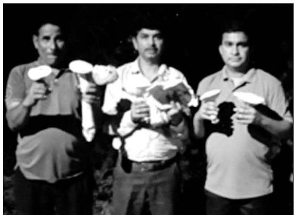
खाद्य दूध छाता मशरूम (केलोसाइबे इंडिका) की नई जंगली प्रजाति की खोज करने वाली टीम।

उदयपुर, (कास)। भारतीय कृषि अनुसंधान परिषद नई दिल्ली के मशरूम अनुसंधान निदेशालय चम्बाघाट के वडा सोलन (हिमाचल प्रदेश) के द्वारा संचालित अखिल भारतीय सर्वांगीण मशरूम अनुसंधान परियोजना, उदयपुर के वैज्ञानिकों ने राजस्थान के विभिन्न वन्य जीव अभ्यारण्यों एवं जंगलों में खाद्य एवं औषधीय मशरूम की विविधता का अध्ययन करने के लिए माह जुलाई-अगस्त में सघन निरीक्षण किया। निरीक्षण के दौरान अभी तक कुल 64 मशरूम प्रजातियों का संग्रहण किया है। निरीक्षण प्रमुख रूप से फुलवारी की नाल, फलासिया-कोटड़ा की नाल, सीतामाता वन्य जीव अभ्यारण्य-प्रतापगढ़, गोगुन्दा, सांडोल माता झालोलाव झल्लारा, सल्लूर के जंगलों का किया गया। अखिल भारतीय समन्वित मशरूम अनुसंधान परियोजना