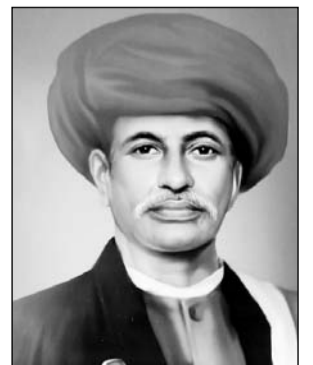
महात्मा ज्योतिबा फुले

ज्योतिबा फुले युग से आगे की सोच रखते थे, इसीलिए महिला