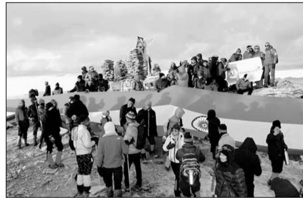
केदारकांठा चोटी पर तिरंगा फहराते पर्वतारोही।