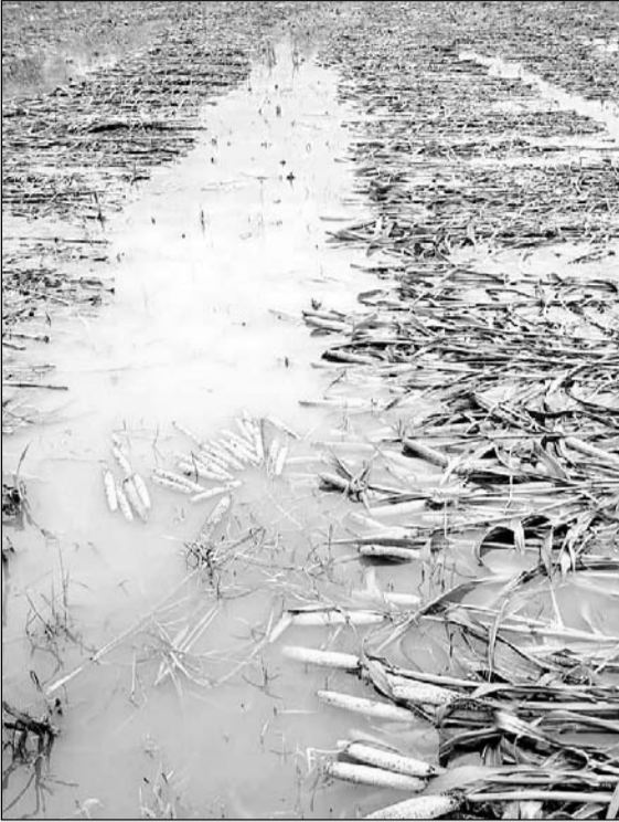
बारिश होने से कटी हुई बाजरे की फसल पानी में तैरने लगी।

मसूदा कस्बे सहित आस-पास के क्षेत्र में शुक्रवार सुबह से ही कहीं रिमझिम तो कहीं मध्यम तेज बरसात हुई। वहीं गुरुवार रात्रि में भी लगातार रुक रुककर बरसात होती रही। शुक्रवार दोपहर से ही कस्बे सहित क्षेत्र में बादलों की गर्जना के साथ तेज मूसलधार बारिश हुई। वहीं दोपहर तक कभी मध्यम दर्जे की बरसात तो कभी रिमझिम बरसात होती रही जिससे संपूर्ण जनजीवन अस्त-व्यस्त हो गया। किसानों ने बताया कि ज्यादा बारिश से विशेष रूप से उड़द की फसलों में भारी नुकसान है।