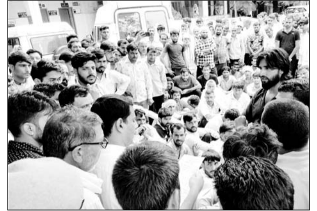
नीमकाथाना कोतवाली पुलिस ने समझाइश कर मामला शांत कराया।