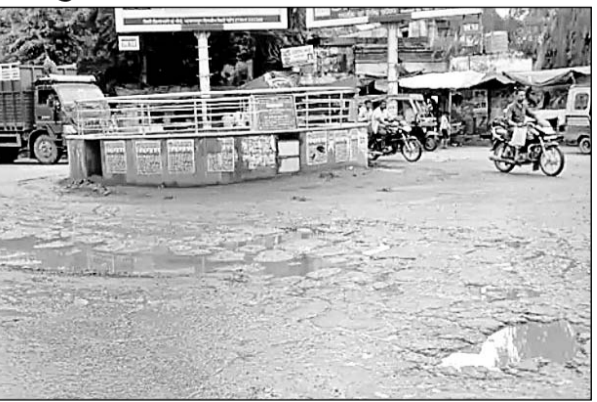
हिण्डौन में सक्रिल के पास बदहाल पड़ी सड़कें।