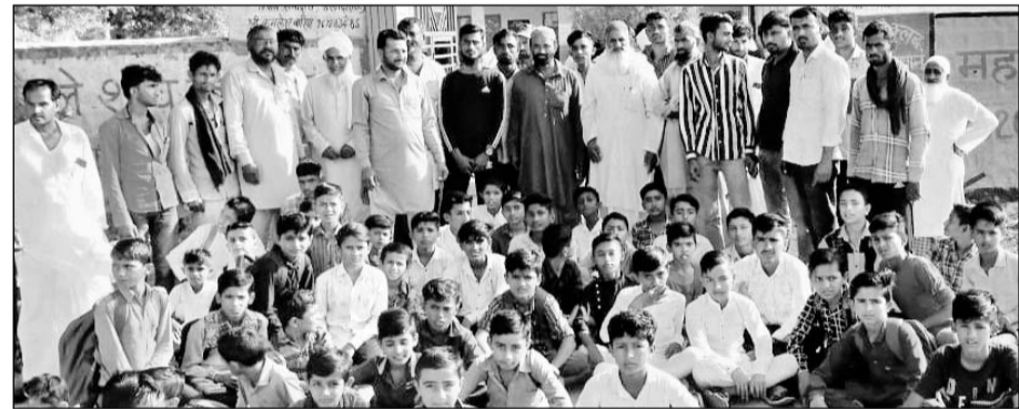
बाप के निकट जोड़ में स्कूल के मुख्य द्वार पर ग्रामीणों ने ताला लगाकर प्रदर्शन किया।

अलावा प्रिंसिपल सहित द्वितीय ग्रेड के विज्ञान, गणित व अंग्रेजी विषय के