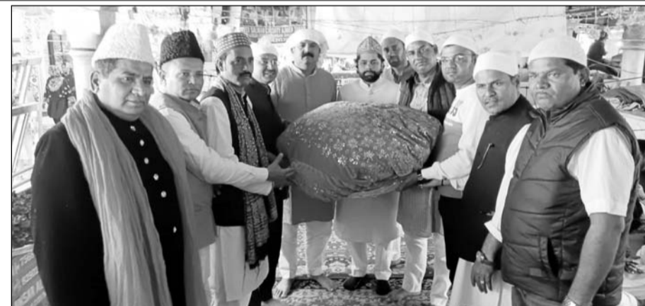
ख्वाजा मोइनुद्दीन हसन चिश्ती के उर्स के मौके पर वसुंधरा राजे की ओर से भेजी गई चादर पेश की।