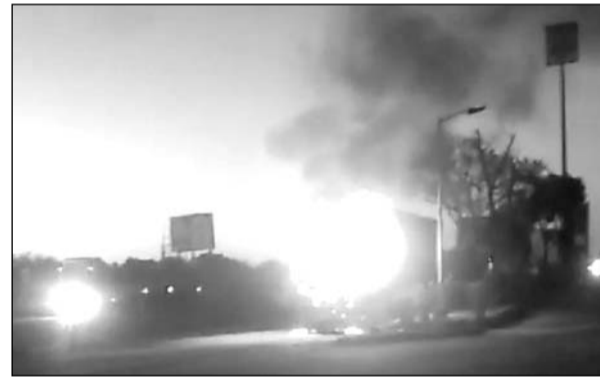
दिल्ली-अजमेर हाइवे पर बिलौची के पास कन्टेनर में आग लग गई।