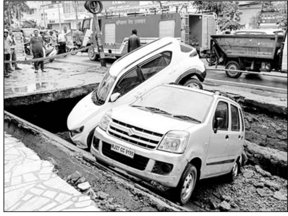
अशोक नगर क्षेत्र में पुराना नाला धंसने से दो कारें उसमें गिर गईं।

उदयपुर, (कांस)। झीलों के शहर में मंगलवार को तीसरे दिन भी दिनभर बारिश होती रही। रूक-रूक जारी बारिश के दौर से शहर के समीप स्थित उदयसागर झील एक बार फिर छलक गई। मंगलवार सुबह उदयसागर के दोनों गेट एक फीट 6 इंच खोल दिए गए वहीं वल्लभनगर बांध (सरजना) भी छलक गया। इधर, सीसारमा नदी तीन फीट के वेग से बह रही है जिससे स्वरूपसागर पर दूसरे दिन भी एक इंच की चादर चल रही है। इधर, बारिश के बीच शहर के अशोक नगर क्षेत्र में पुराना नाला धंसने से दो कारें उसमें गिर गईं।