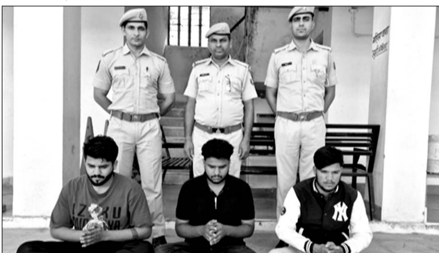
राजसमंद के कांकरोली थाना पुलिस ने पिस्टल को साथ रख बनाये वीडियो के वायरल करने के आरोपियों को गिरफ्तार किया।

राजसमंद , (निसं)। कांकरोली थाना पुलिस ने सोशल मीडिया पर करीब छह माह पूर्व पिस्टल को साथ रख बनाये वीडियो के वायरल होने पर तीन जनों को गिरफ्तार किया है। आरोपियों के अनुसार वीडियो में दिख रही पिस्टल प्लास्टिक की न होकर नकली है, जिसे वीडियो बनाने के बाद फैंक दिया था। यह वीडियो किसी मिलने वाले ने सोशल मीडिया पर अपलोड कर दिया है। भविष्य में इस प्रकार की घटनाओं को रोकने के लिए इन तीनों जनों को पुलिस ने गिरफ्तार किया।