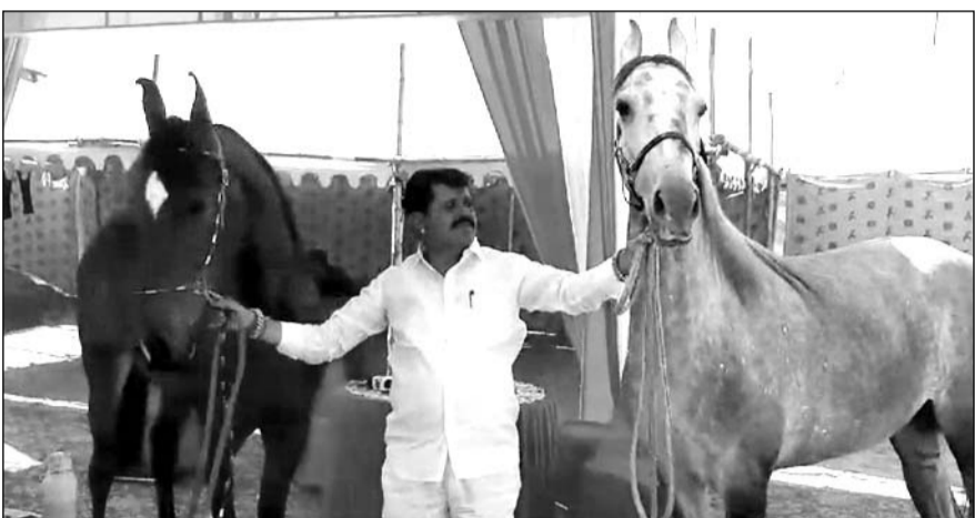
पुष्कर मेले में लजरी कारों से महंगी घोड़ियां आई हुई हैं।

नागौर जिले के रोहिणा गांव से पहुंची दो घोड़िया सभी लोगों का मन मोह रही है और घोड़ियों को खरीदने के लिए 50 से 70 लाख तक लग चुके हैं। घोड़ियों के मालिक बताते हैं कि फिलहाल इन्हें और बढ़ा किया जाएगा उसके बाद ही बेचा जाएगा क्योंकि अभी यह दोनों घोड़िया मात्र 23 महीने की है। दोनों ही अश्व राजस्थान के प्रसिद्ध घोड़े अमोक्तक के परिवार से हैं जिसका नाम रूद्राणी है। इसके अलावा रानी जिंदा