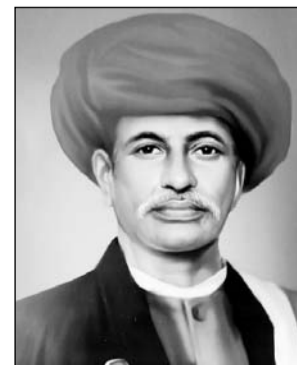
महात्मा ज्योतिबा फुले

हवा। असल में वर्ष 1848 में उनके साथ एक ऐसी घटना घटी जिसने उन्हें झकझोर दिया। वह अपने एक मित्र के विवाह में शामिल होने के लिए गए थे। मित्र उच्च कुल का था और विवाह समारोह में उनके साथ अपमानित व्यवहार हुआ। उन्होंने तभी तय कर लिया जाति व्यवस्था की इस कुप्रथा को वह जड़ से समाप्त करेंगे। यही बाद में हुआ भी। उन्होंने शुरुआत कहीं और से नहीं अपने ही घर से की। दलितों को अपने घर के कुएं को प्रयोग करने की अनुमति दे दी। दलितों और महिलाओं में अंधविश्वास के कारण उत्पन्न हुई आर्थिक और सामाजिक विसंगतियों को दूर करने के लिए भी उन्होंने आंदोलन चलाया। उनका मानना था कि यदि आजादी, समानता, मानवता, आर्थिक न्याय, शोषणरहित मूल्यों और भाईचारे पर आधारित सामाजिक व्यवस्था का निर्माण करना है तो असमान और शोषक समाज को उखाड़ फेंकना होगा। ज्योतिबा फुले युग से आगे की सोच रखते थे, इसीलिए महिला