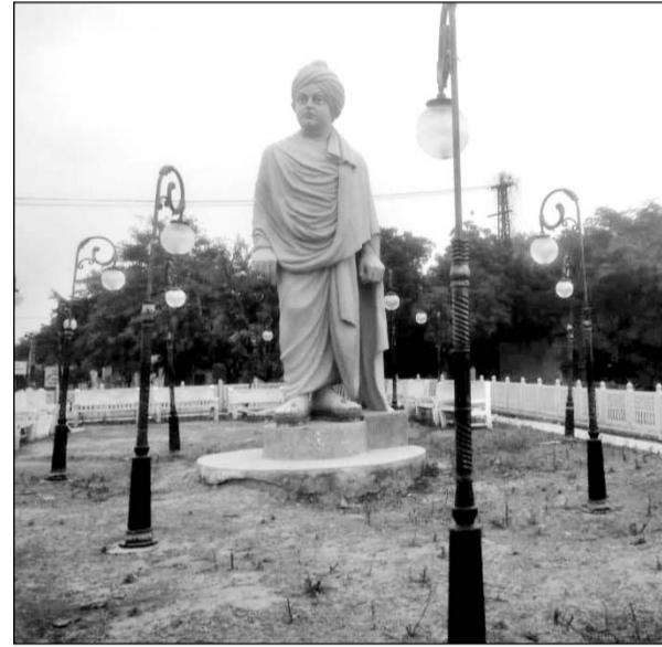
विवेकानंद सर्किल पर उगी झाड़ियां व टूटी पड़ी कुर्सियां।

सिलसिला बना रहता है। फिर भी आज दिन तक किसी ने विवेकानंद सर्किल की बदहाली को तरफ अपना ध्यान देना मुनासिब नहीं समझा यदि समय रहते हुए नगर पालिका प्रशासन तथा उच्चाधिकारियों ने इसकी बदहाली को तरफ ध्यान नहीं दिया तो हो सकता है यह सर्किल आने वाले समय में अपनी महत्ता खो न दे वही अब तो सवाल यह उठ रहा है कि आधिकारिक इसकी सुध कौन लेगा।