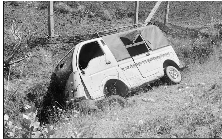
सरवाड़ में निजी शिक्षण संस्थान में अध्ययनरत बच्चों से भरा टेम्पो अनियंत्रित होकर पलट गया।

सरवाड़, (निसं)। सरवाड़ निकटवर्ती गांव प्रतापपुरा से हींगतड़ा जाने वाले रास्ते पर निजी शिक्षण संस्थान में अध्ययनरत बच्चों से भरा एक टेम्पो अनियंत्रित होकर पलटने से बड़ा हादसा हो गया। टेम्पो में करीब 15 छात्र-छात्राएं सवार थे, जिनमें से तीन को गंभीर चोटें आई हैं। सभी घायलों को उपचार के लिए केकड़ी के राजकीय जिला चिकित्सालय में भर्ती