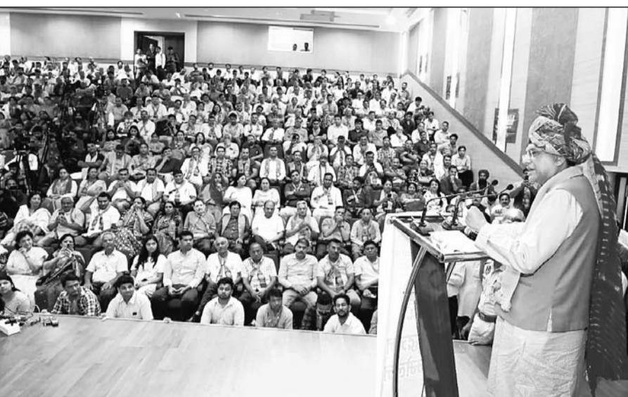
केंद्रीय मंत्री पीयूष गोयल ने रविवार को भाजपा जयपुर शहर की ओर से मानसरोवर स्थित विद्यालय में प्रबुद्धजन सम्मेलन को संबोधित किया।