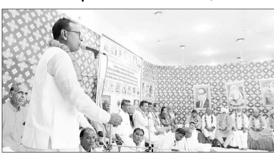
विश्व वाल्मीकि धर्म संसद परिषद की धर्म संसद, सत्संग और संत समागम रविवार को गलता रोड हीदा की मोरी स्थित गुरुद्वारा में अयोजित किया गया।