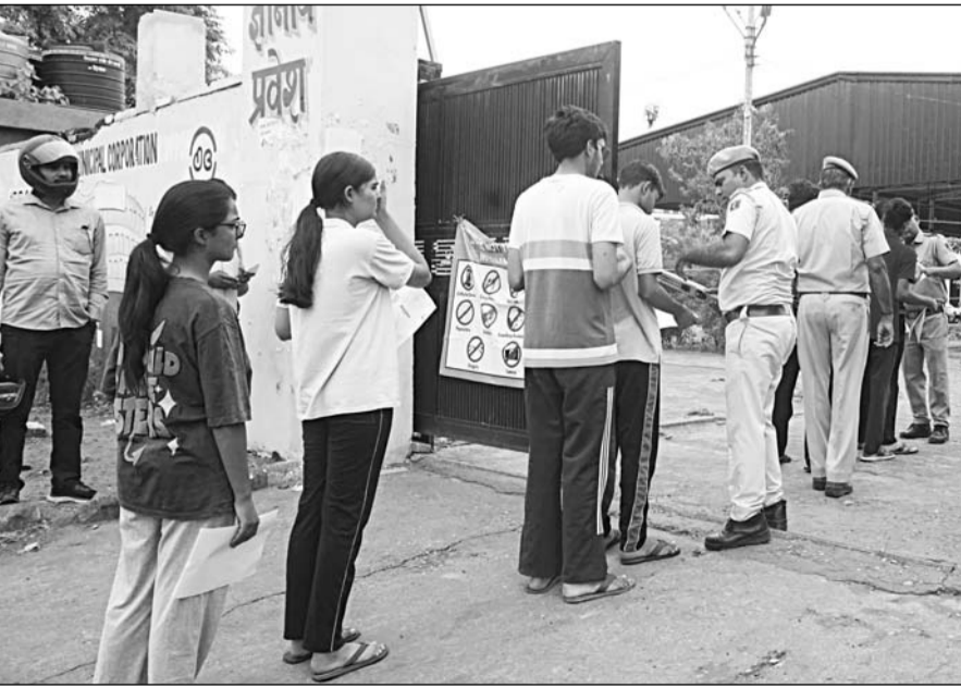
नीट परीक्षा देने पहुंचे अभ्यर्थियों को परीक्षा केंद्र में प्रवेश देने से पूर्व पुलिस ने उनकी गहनता से जांच की। सहायता से अभ्यर्थियों के बालों तक की गहन जांच की। निर्धारित समय के अनुसार दोपहर 1:30 बजे परीक्षा केंद्रों के प्रवेश द्वार बंद कर दिए गए और इसके बाद किसी भी अभ्यर्थी को प्रवेश नहीं दिया गया। गांधी नगर स्थित केंद्रों पर अंतिम समय तक लाउडस्पीकर के माध्यम से अभ्यर्थियों को समय पर पहुंचने के निर्देश दिए जाते रहे।

-कार्यालय संवाददाता- जयपुर। राष्ट्रीय पात्रता सह प्रवेश परीक्षा (नीट-यूजी) की पुनः परीक्षा रविवार को राजधानी जयपुर में कड़े सुरक्षा प्रबंधों और प्रशासनिक निगरानी के बीच शांतिपूर्ण एवं सुव्यवस्थित ढंग से संपन्न हुई। जयपुर जिले के 103 परीक्षा केंद्रों पर आयोजित परीक्षा में 37128 अभ्यर्थी पंजीकृत थे। जिनमें से 34031 अभ्यर्थी उपस्थित रहे, जबकि 3,097 अनुपस्थित रहे। इस प्रकार कुल उपस्थित 91,66 प्रतिशत दर्ज की गई। परीक्षा दोपहर 2 बजे शुरू होकर शाम 5:15 बजे समाप्त हुई। नेशनल टेस्टिंग एजेंसी (एनटीई) ने अभ्यर्थियों को 15 मिनट का अतिरिक्त समय दिया। परीक्षा समाप्त होने के बाद 22 गोदाम सिकल, परकोटा क्षेत्र के प्रमुख बाजारों तथा शहर के कई व्यस्त मार्गों पर परीक्षाार्थियों और उनके परिजनों की भीड़ उमड़ने से यातायात व्यवस्था प्रभावित रही और कई स्थानों पर वाहन रंगते नजर आए। परीक्षा की संवेदनशीलता को देखते हुए इस बार अभूतपूर्व सुरक्षा व्यवस्था की गई थी। अभ्यर्थियों को परीक्षा केंद्र में प्रवेश से पहले श्री-लेयर सिक्वोरिटी जांच से