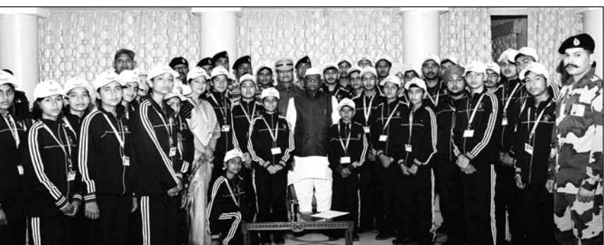
राज्यपाल हरिभाऊ बागडे से शनिवार को राजभवन में भारत दर्शन यात्रा पर आए 35 विद्यार्थियों के दल ने मुलाकात की। सीमा सुरक्षा बल द्वारा आयोजित यह दल जम्मू तवी से जयपुर यात्रा पर आया हुआ है। इस दौरान राज्यपाल से संवाद में उन्होंने भारत दर्शन यात्रा के अपने अनुभव साझा किए। राज्यपाल बागडे ने एक भारत श्रेष्ठ भारत की संकल्पना के अंतर्गत इस तरह की यात्राओं को महत्वपूर्ण बताया। उन्होंने राजस्थान की संस्कृति, वीरता और शौर्य की चर्चा करते हुए गौरवमय अतीत से जुड़े राजस्थान के शौर्य और वीरता के किस्से-कहानियों में यहां के किले-महल्लों और मंदिरों के स्थापत्य के साथ राष्ट्रीयता से जुड़े मूल्यों पर विद्यार्थियों से संवाद किया। भारत दर्शन पर आए 35 विद्यार्थियों के इस दल में 20 लड़कें और 15 लड़कियां सम्मिलित हैं।