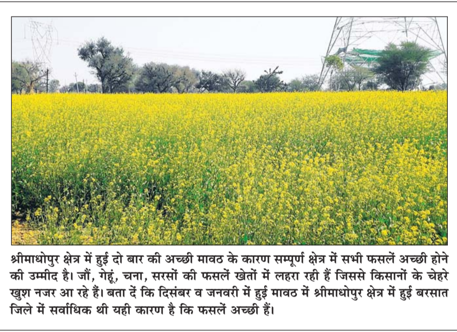
श्रीमाधोपुर क्षेत्र में हुई दो बार की अच्छी मावठ के कारण सम्पूर्ण क्षेत्र में सभी फसलें अच्छी होने की उम्मीद है। जौं, गेहूं, चना, सरसों की फसलें खेतों में लहरा रही हैं जिससे किसानों के चेहरे खुश नजर आ रहे हैं। बता दें कि दिसंबर व जनवरी में हुई मावठ में श्रीमाधोपुर क्षेत्र में हुई बरसात जिले में सर्वाधिक थी यही कारण है कि फसलें अच्छी हैं।