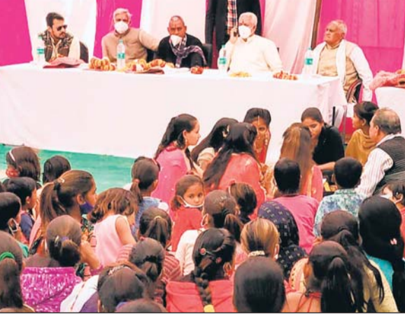
बगड़ी ग्राम में लोकार्पण कार्यक्रम में मौजूद चिकित्सा एवं स्वास्थ्य मंत्री परसादी लाल मीणा एवं छात्र-छात्राएं।