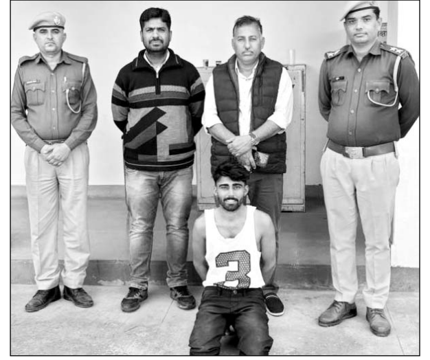
सीआईडी क्राइम ब्रांच रेंज सेल जोधपुर की टीम ने आरोपी होटल संचालक को गिरफ्तार किया।