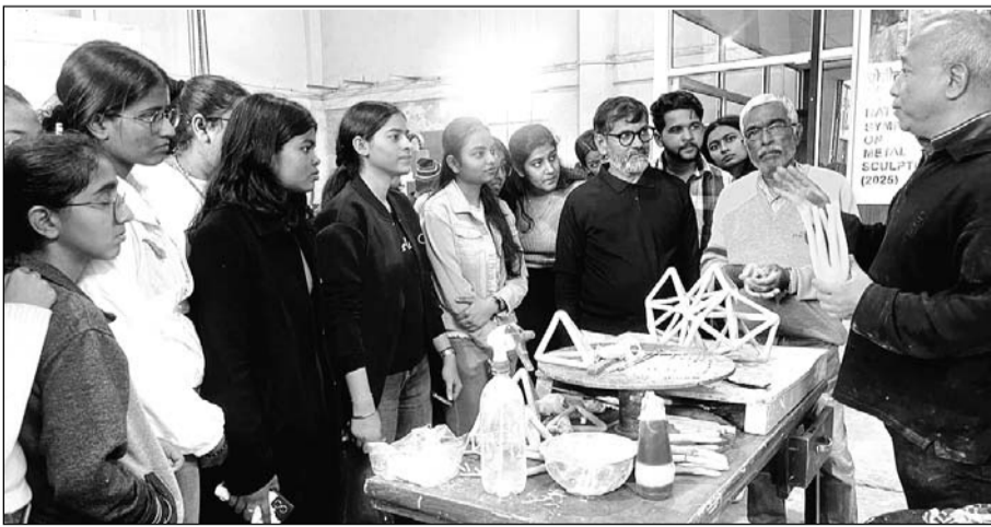
एलन कॉलेज ऑफ डिजाइन, जयपुर के 50 स्टूडेंट्स ने सिम्पोजियम की विजिट की।

■ तीसरी नेशनल सिम्पोजियम ऑन मेटल स्कल्पचर में जाने-माने आर्टिस्ट की कला को जाने व समझने के लिए बड़ी संख्या में स्टूडेंट्स पहुंच रहे हैं