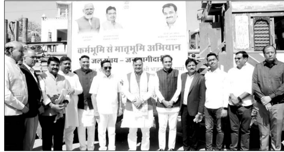
महाराणा प्रताप की प्रतिमा पर पुष्पांजलि नमन के साथ केन्द्र परिसर पर कर्मभूमि से मातृभूमि अभियान का शुभारंभ करते मुख्यमंत्री भजन लाल शर्मा और केन्द्रीय जल शक्ति मंत्री सीआर पाटिल।

उदयपुर, (निसं)। मुख्यमंत्री भजनलाल शर्मा और केन्द्रीय जल शक्ति मंत्री सीआर पाटिल मंगलवार को प्रताप गौरव केन्द्र "राष्ट्रीय तीर्थ" पहुंचे और उन्होंने महाराणा प्रताप की विशाल बैठक प्रतिमा पर पुष्पांजलि नमन के साथ केन्द्र के परिसर पर "कर्म भूमि से मातृभूमि अभियान" के तहत जल संचय-जन भागीदारी के अन्तर्गत वाकैवल का विधिवत पूजन कर शुभारंभ किया। जल संचयन हेतु जनभागीदारी सुनिश्चित करने के प्रधानमंत्री नरेन्द्र