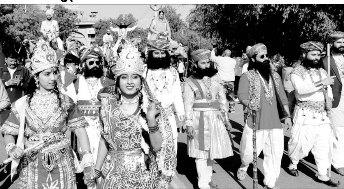
कार्निवल में राधा-कृष्ण के रूप में सजे बच्चों एवं विंटेज कारों में बैठे देशी-विदेशी पर्यटक स्थानीय लोक धुन पर थिरकते नजर आए।