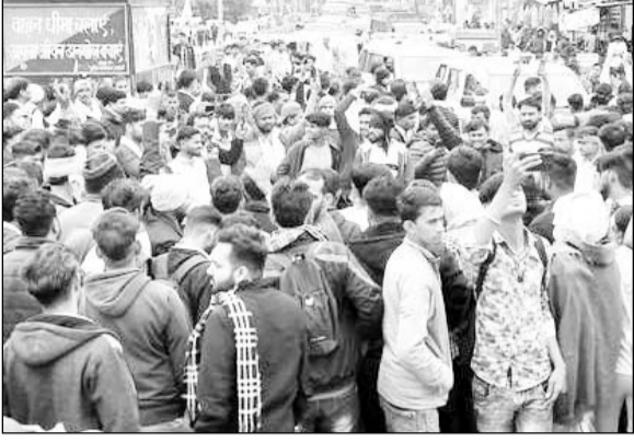
करौली कलेक्ट्रेट सफिकल पर पीड़ित परिवारजनों के साथ लोगों ने धरना देकर जाम लगाया।