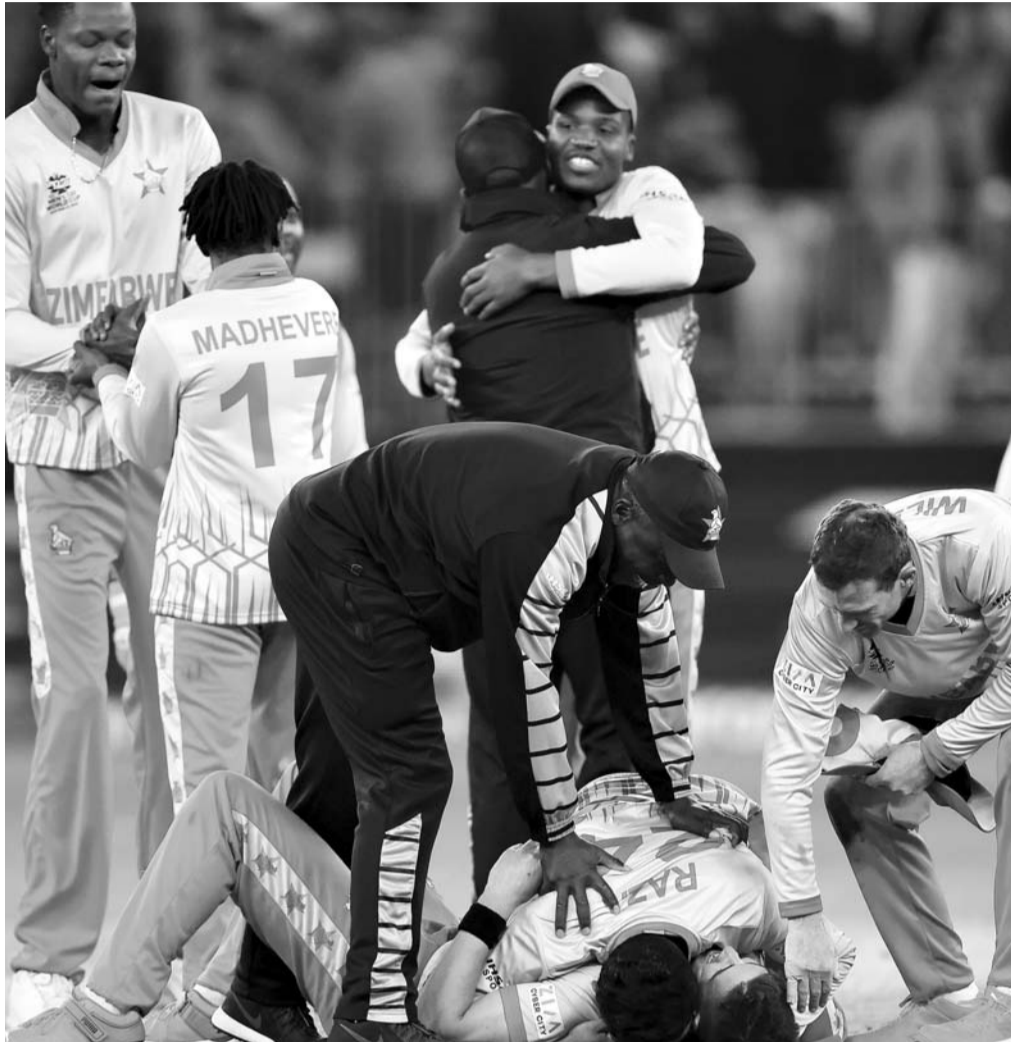
ज़िम्बाब्वे ने ग्रुप-2 के मैच में टॉस जीतकर बल्लेबाजी चुनी और पावरप्ले में दो विकेट के नुकसान पर 47 रन जोड़ लिये। ज़िम्बाब्वे एक अच्छी शुरुआत के दम पर बड़े स्कोर की तरफ अग्रसर थी लेकिन शादाब ने मध्य ओवरों में विकेट

बाबर आजम की टीम को आखिरी ओवर में 11 रन की दरकार थी और मोहम्मद नवाज़ विकेट पर मौजूद थे। नवाज़ ने पहली गेंद पर तीन रन लिये लेकिन जब पाकिस्तान को दो गेंदों में तीन रन चाहिए थे, तब नवाज़ आउट हो गये। शाहीन शाह अफरीदी ने आखिरी गेंद पर दो रन लेकर मैच को टाई करवाना चाहा लेकिन रेंजिस चक्राव्वा ने उन्हें रनआउट कर दिया और ज़िम्बाब्वे ने यह मैच मात्र एक रन से जीत लिया।