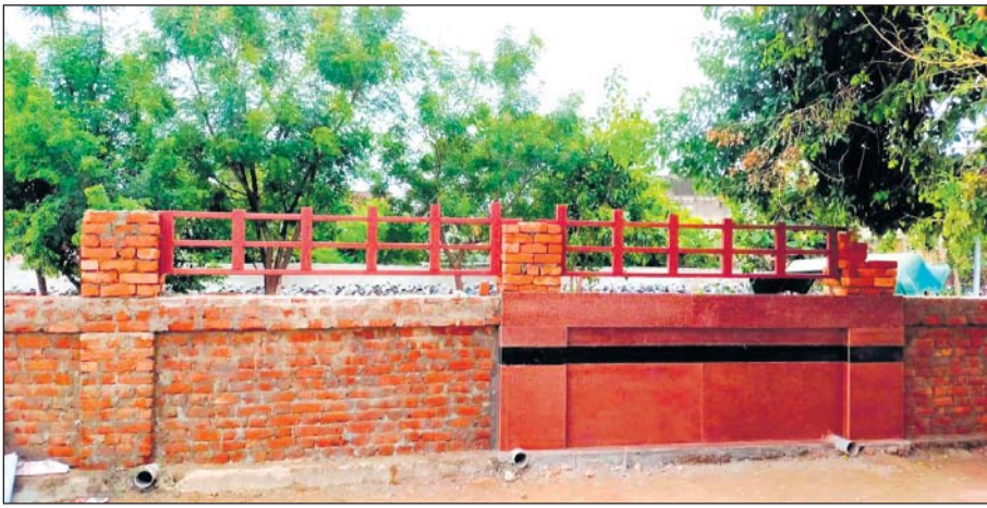
अमृत भारत स्टेशन योजना के अंतर्गत फुलेरा रेलवे स्टेशन का पुनर्विकास कार्य किया जा रहा है।