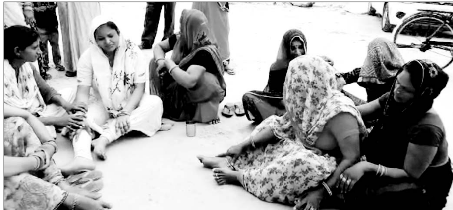
प्रसूता की मौत के बाद शोक में डूबा परिवार।

डॉक्टर परिजनों से ब्लड की व्यवस्था करने की कहते रहे और प्रसूता की मौत हो गई