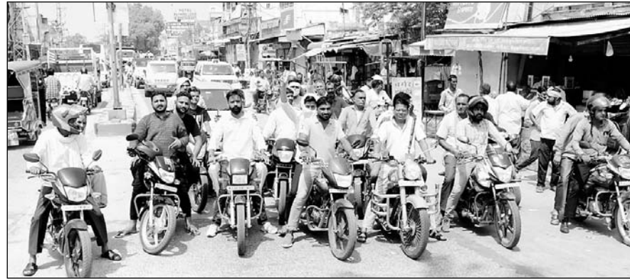
घटना के विरोध में हिन्दू संगठनों ने शहर के मुख्य बाजार में बाइक रैली निकाली।

आरएसी की टुकड़ी भी तैनात रही। इंटरनेट सेवा आगामी आदेश तक बंद कर दी गई और चूरू जिले में कलेक्टर के आदेश पर धारा 144 लागू की गई। आवश्यक सेवाओं को छोड़कर पूर्णतया बाजार बंद रहे। बंद के चलते शहर में वाहनों की आवाजाही भी काफी कम रही। सुरक्षा व्यवस्था को लेकर पुलिस शहर के मुख्य बाजार में तैनात थी। वहीं बाजारों में घोर सत्राटा पसर रहा और घहरवासियों ने इस कारयता पूर्ण कृत्य की कड़ी निन्दा की। वहीं इस घटना को लेकर लोगों में काफी आक्रोश देखने को मिला।