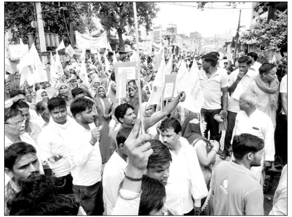
अलवर के राजगढ़ में 12 प्रतिशत अलग से आरक्षण की मांग को लेकर सैनी समाज ने रैली निकाली।

सैनी समाज के हजारों लोगों ने रैली निकाल कर प्रदर्शन किया