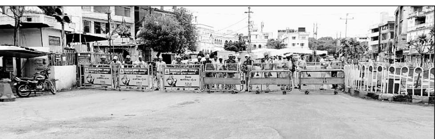
उदयपुर में कर्फ्यूग्रस्त इलाकों व शहर में चप्पे-चप्पे पर पुलिस बल तैनात रहा।