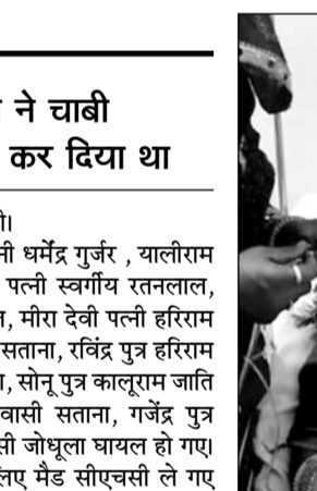
घायल दुल्हन का अस्पताल में उपचार किया।