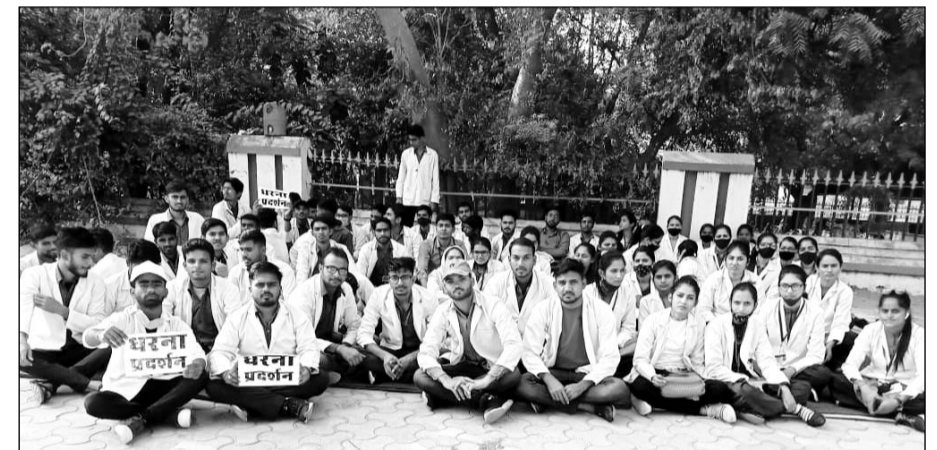
चुरू नर्सिंग कॉलेज के विद्यार्थी अपनी मांगों को लेकर धरने बैठे।

राज्य सरकार के मंत्रियों, विधायकों को कई बार अवगत करवाने के बावजूद आज तक किसी के कानों में जूँ तक नहीं रेंगी। इन परेशानियों को देखते हुये विद्यार्थियों को