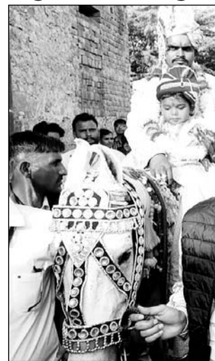
पंचायत कैरोडी में निकासी निकालते लोग।