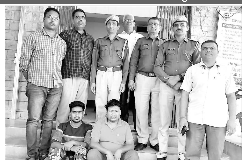
बाड़मेर में कोतवाली पुलिस ने सोना चोरी के मामले में दो आरोपियों को गिरफ्तार किया।