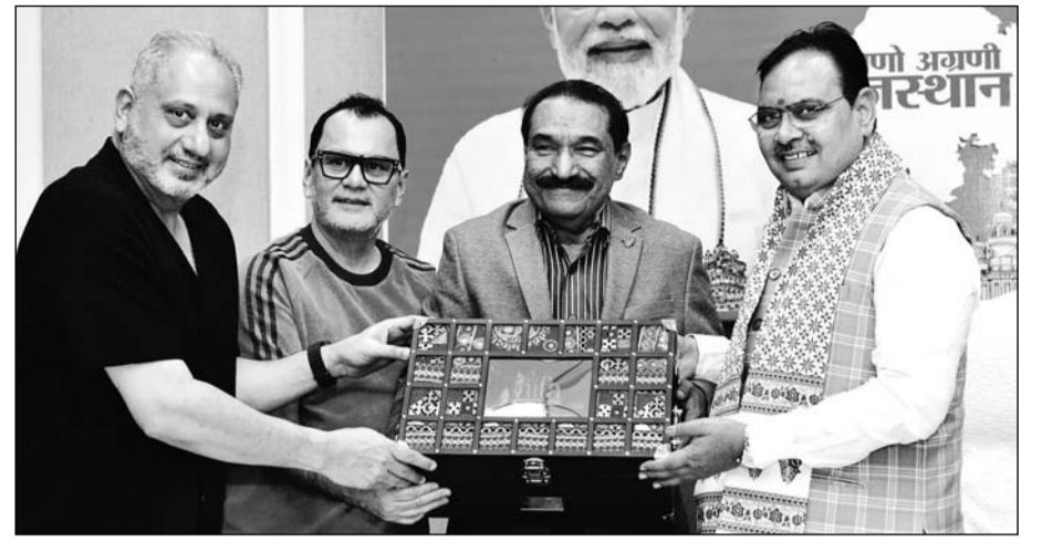
आईफा अवार्ड्स आयोजन समिति के सदस्यों ने मुख्यमंत्री भजनलाल शर्मा से मंगलवार को उनके निवास पर मुलाकात की।

जयपुर। मुख्यमंत्री भजनलाल शर्मा से मंगलवार को आईफा अवार्ड्स आयोजन समिति के सदस्यों ने मुख्यमंत्री निवास पर मुलाकात कर आईफा अवार्ड्स समारोह में शामिल होने का निमंत्रण दिया। समिति सदस्यों ने 8 एवं 9 मार्च को राजधानी जयपुर में आयोजित होने वाले समारोह सहित विभिन्न कार्यक्रमों की विस्तृत जानकारी