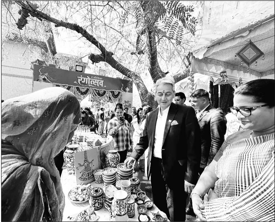
जयपुर शासन सचिवालय में मंगलवार को मुख्य सचिव सुधांशु पंत ने राजीविका रंगोत्सव-2025 का शुभारंभ किया। इसके बाद उन्होंने शर्बत स्टॉल, बगरू प्रिन्ट दुपट्टा, कशीदाकारी बैग, बाजरा कुकीज आदि स्टॉलों से खरीददारी कर महिला उद्यमियों का उत्साह बढ़ाया।

जयपुर। शासन सचिवालय में मंगलवार को मुख्य सचिव सुधांशु पंत द्वारा राजीविका रंगोत्सव-2025 का शुभारंभ किया गया। यह आयोजन शासन सचिवालय में 4 मार्च से 7 मार्च तक आयोजित किया जा रहा है, जिसमें राजीविका से जुड़ी स्वयं सहायता समूह की महिलाओं के उद्यमशीलता को सफलता को प्रदर्शित किया जायेगा। मुख्य सचिव ने शर्बत स्टॉल, बगरू प्रिन्ट दुपट्टा, कशीदाकारी बैग, बाजरा कुकीज आदि स्टॉलों से खरीददारी कर महिला उद्यमियों का उत्साह बढ़ाया। स्वयं सहायता समूह की महिलाओं से बातचीत की और आत्मनिर्भरता की दिशा में उनके प्रयासों की सराहना की। उन्होंने राजसमंद व जोधपुर जिलों में शर्बत व बाजरा आधारित उत्पादों की विक्री की सराहना की। राजीविका रंगोत्सव में