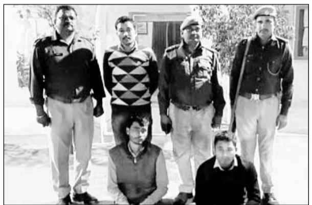
पुलिस ने आरोपियों को गिरफ्तार किया।