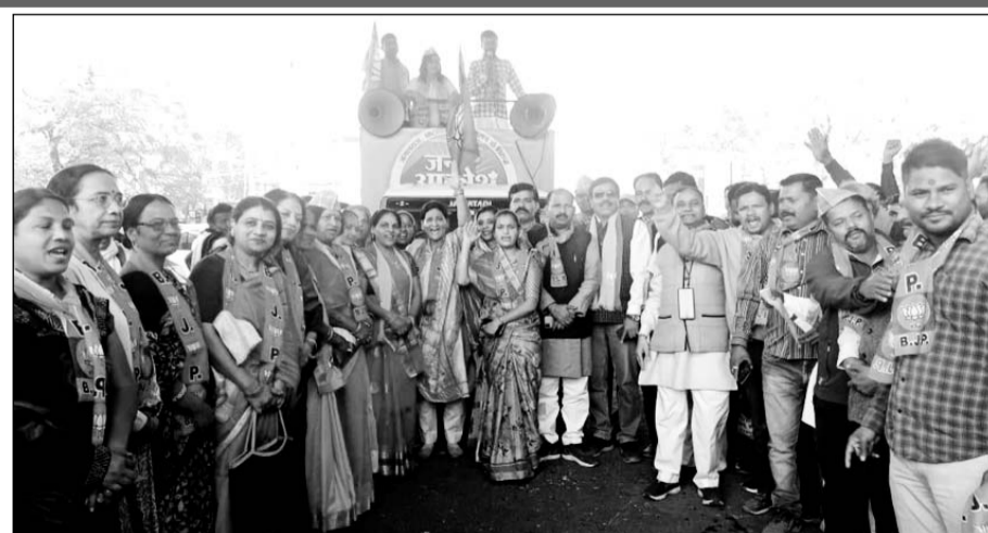
कोटा में जन आक्रोश रैली में भाजपा समर्थक महिलाओं ने बड़बड़ कर भाग लिया।