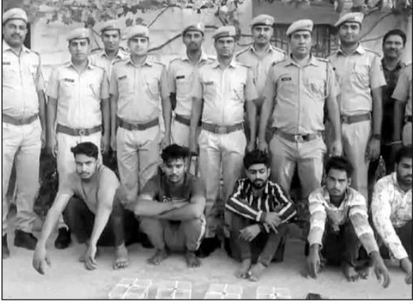
पुलिस ने डकैती की योजना बनाते पांच बदमाशों को गिरफ्तार किया।