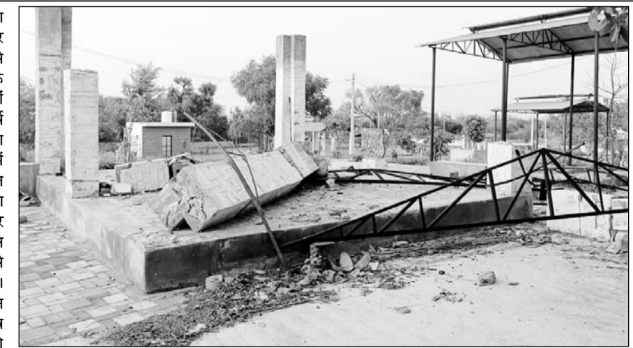
सांभर के शमशान घाट में तुफान से उड़े टीनशेड आज भी यथास्थिति में पड़े हुये हैं।