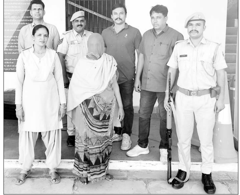
राजसमंद पुलिस ने पति की हत्या के आरोप में पत्नी को गिरफ्तार किया।

मारपीट से तंग आकर पत्नी ने ही की पति की हत्या