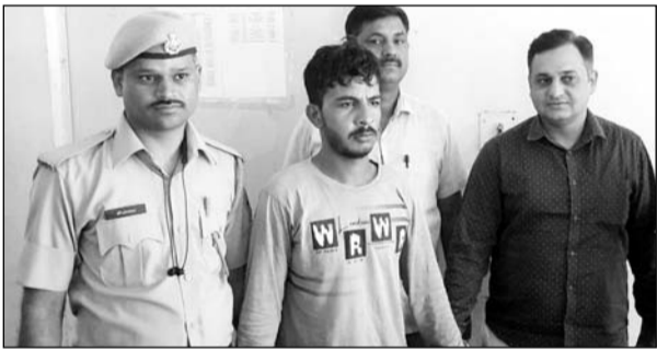
पुलिस ने ईरानी गैंग के बदमाश को पकड़ा।