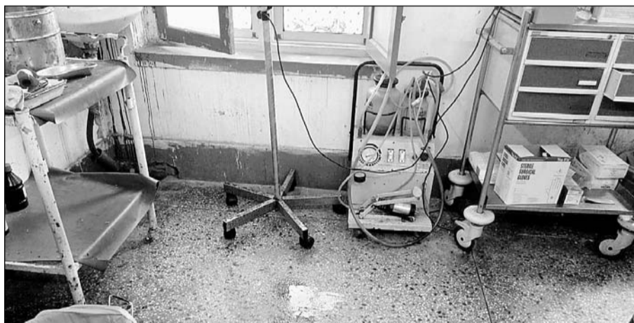
पावटा सीएचसी के इमरजेंसी वार्ड में पानी टपकने से उपकरण खराब हो रहे हैं।

नतीजा लगातार हो रही बारिश से अस्पताल में कई जगहों पर छत से पानी टपकने लगा है। अस्पताल के इमरजेंसी वार्ड, जनरल वार्ड, इमरजेंसी वार्ड के बाहर पूरे बरामदे सहित कई जगह पानी टपकने से मरीजों को परेशानियों का सामना करना पड़ा। इमरजेंसी वार्ड में तो छत से टपक रहे पानी से दीवारों में करंट तक दौड़ गया। इससे कभी भी कोई बड़ा हादसा हो सकता है।