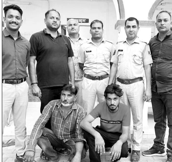
पुलिस ने अवैध मादक पदार्थ सहित दो तस्करों को गिरफ्तार किया।

रामगंजमंडी, (निर्स)। रामगंजमंडी पुलिस द्वारा अवैध मादक पदार्थ एवं तस्करों के खिलाफ विशेष अभियान चलाया जा रहा है, जिसके तहत मोड़क के बाद टीम थाना रामगंजमंडी द्वारा भी एक कार्रवाई को अंजाम दिया गया, जिसमें पुलिस ने अवैध मादक पदार्थ तस्करी के खिलाफ कार्रवाई करते हुए 20 किलो 160 ग्राम अवैध मादक