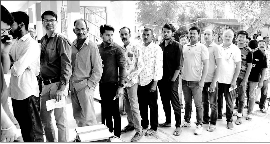
जयपुर के मतदान केंद्रों पर सुबह 6 बजे से ही वोटिंग के लिए लोगों की कतारें लगना शुरू हो गईं। सुबह 7 बजे जैसे ही वोटिंग शुरू हुई तो लोगों ने बारी-बारी से अपने प्रत्याशियों के पक्ष में मतदान किया।