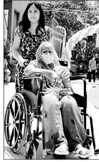
चलने फिरने में असक्षम बुजुर्ग महिला व्हीलचेयर से वोट देने के लिए पहुंची।