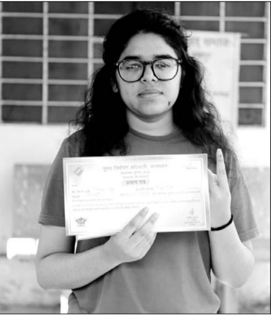
पहली बार वोट देने पहुंचे युवाओं ने सर्टिफिकेट के साथ सेल्फी ली।