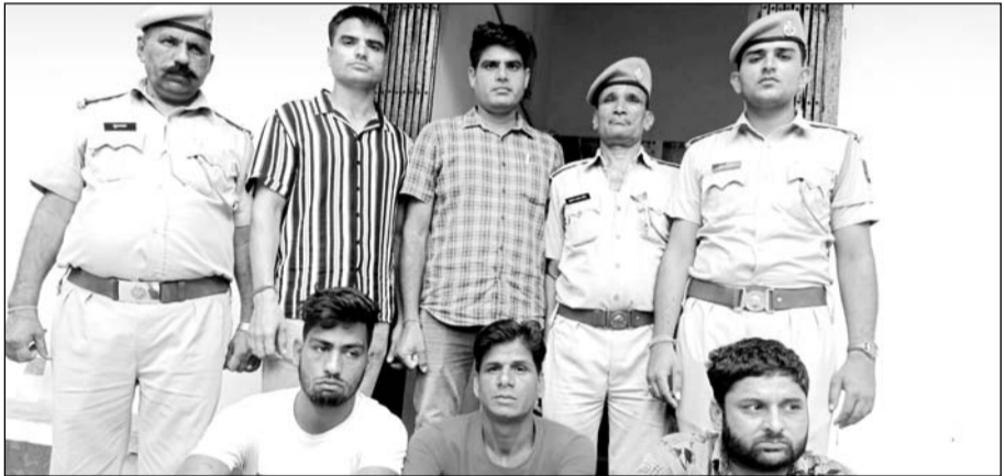
पुलिस टीम ने कार्यवाही कर तीन युवकों को गिरफ्तार किया।

टोंक, (निसं)। पुरानी टोंक थाना क्षेत्र में एक युवक व युवती को धमकाकर सुनसान इलाके में ले जाया गया, जहां उनको निर्बस्त्र कर अश्लील वीडियो बनाया गया तथा युवक के परिवार को जान से मारने की धमकी देकर पांच लाख रूपये लिये जाने का मामला थाने में दर्ज कराया गया। मामले की गम्भीरता को देखते हुए पुलिस टीम ने कार्यवाही कर युवक व महिला को सकुशल दस्तयाव कर तीन युवकों को गिरफ्तार कर लिया।