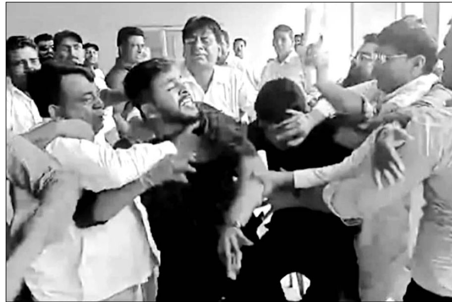
अजमेर में कांग्रेसियों के बीच विवाद हो गया।