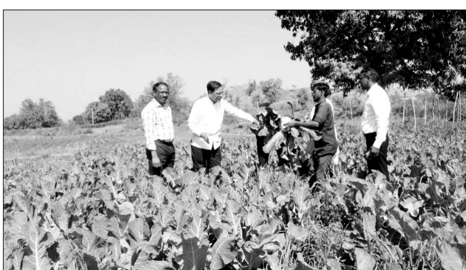
मोदपुर गांव में प्रक्षेत्र दिवस पर फूलगोबी का परीक्षण करते कृषि वैज्ञानिक।